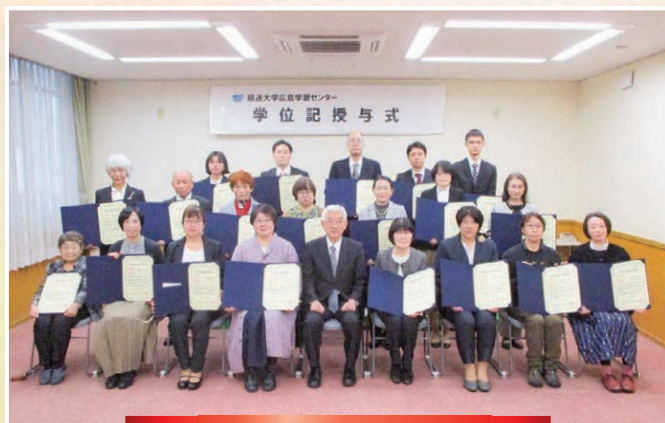
広島学習センター