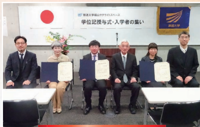
福山サテライトスペース