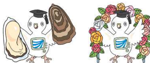
放送大学マスコットキャラクター