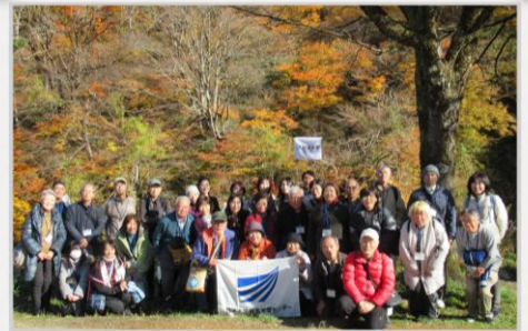
放送大学の仲間たちと・・・