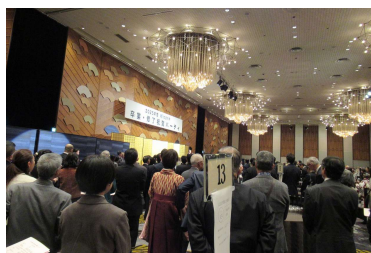
卒業・修了祝賀パーティー(ホテルニューオータニ)