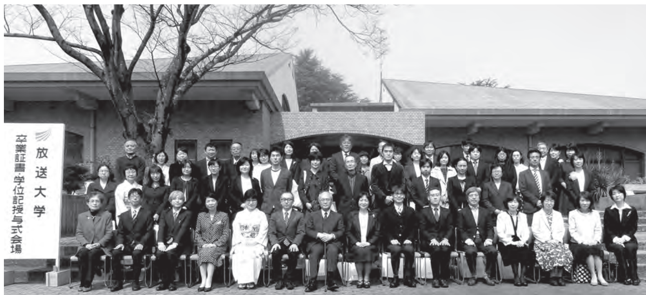
福岡学習センターでの記念撮影の様子