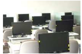
視聴学習室(イメージ)