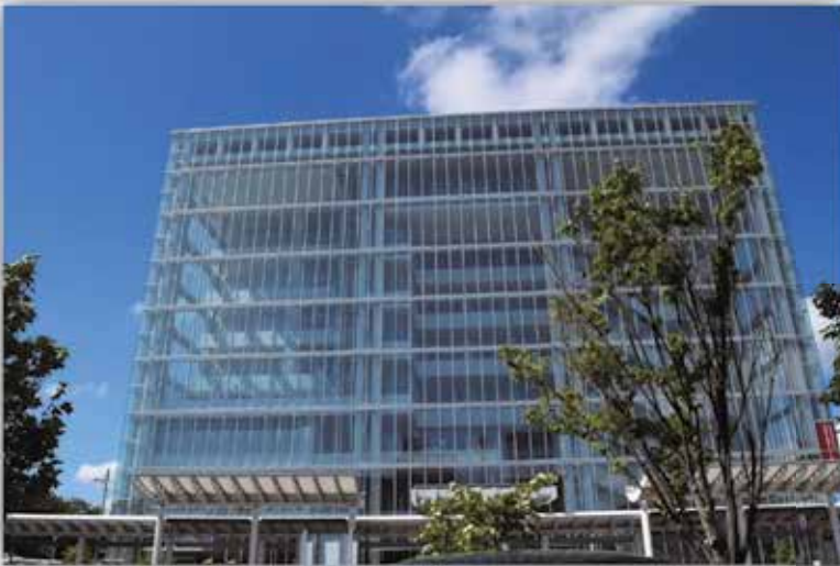
放送大学福井学習センター (福井駅東口 AOSSA アオッサ7階)