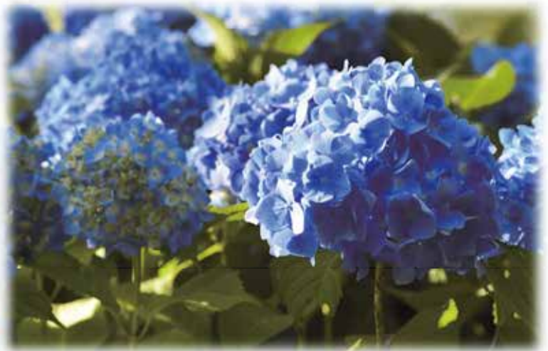
福井市 足羽山あじさいロード(6月上旬)