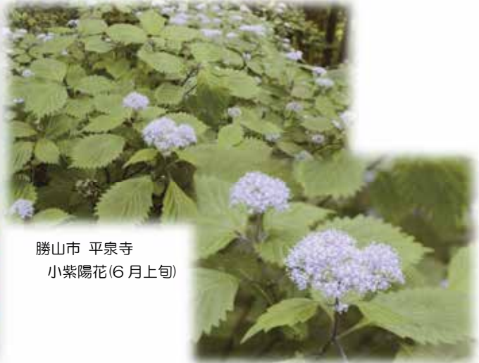
勝山市 平泉寺 小紫陽花(6月上旬)