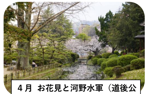
4月 お花見と河野水軍 (道後公)