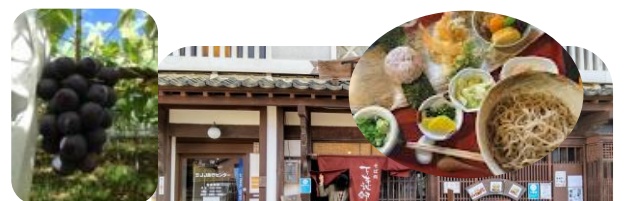
内子古民家散策 (食事) とブドウ狩り