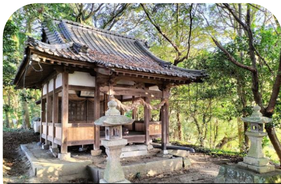
11月 漱石と「鎌倉殿の13人」と鎌倉神社