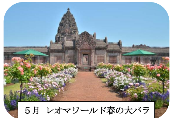
5月 レオマワールド春の大バラ