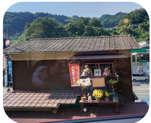
ワンちゃんも手を振ってのお出迎え