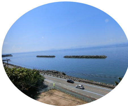
晴れわたる伊予灘