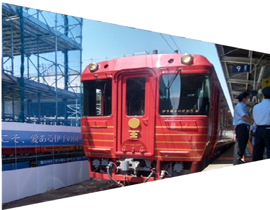
出発前の列車と令和6年度完成予定の高架工事の松山駅