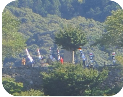
旗を振る大洲藩士