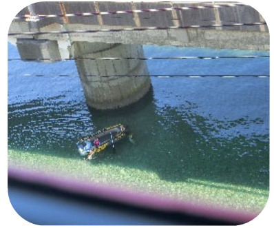
ボート遊びをする串海岸