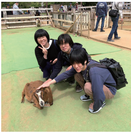
はじめての牧場体験

を食べました(羊さんごめんさい)。午後は生マッシュマロ作りに挑戦。これは材料が固くなるまで延々とかき混ぜて空気を入れなければならず、手マメができてしまうほど大変でした(汗)。またオリンピック種目にもあるアーチェリーも体験。見事に的の中心を射抜き、ソフトクリーム引換券をゲットしました。