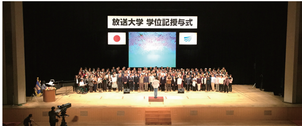
前日のリハーサル風景。本番は全国にテレビ中継を行なった

3月23日、前日のリハーサルに続き全国から集まった200名近くの学生が全員胸ワクワク、ドキドキさせてNHKホールのステージに立ちました。