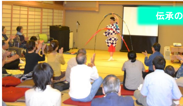
伝承のひろば・夏