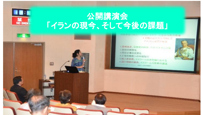
公開講演会 「イランの現今、そして今後の課題」