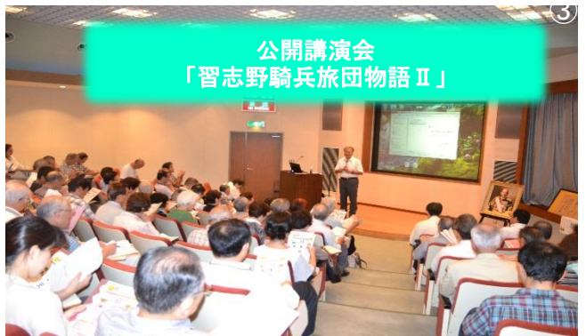
公開講演会 「習志野騎兵旅団物語Ⅱ」