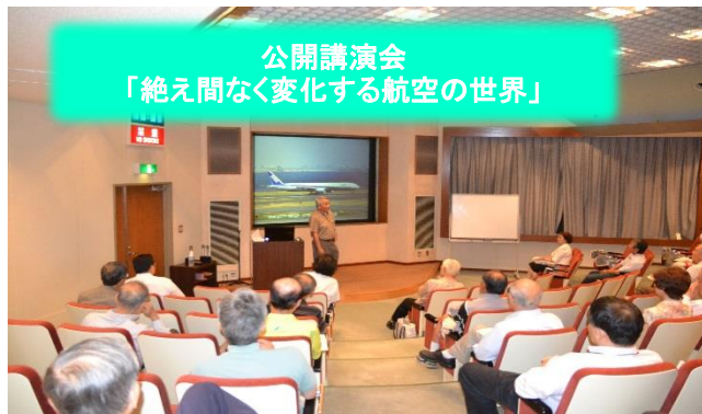
公開講演会 「絶え間なく変化する航空の世界」