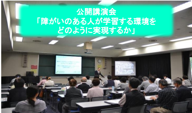
公開講演会 「障がいのある人が学習する環境を どのように実現するか」

THE OPEN UNIVERSITY OF JAPAN / CHIBA STUDY CENTER