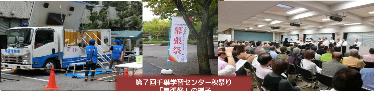
第7回千葉学習センター秋祭り 「幕張祭」の様子

THE OPEN UNIVERSITY OF JAPAN / CHIBA STUDY CENTER