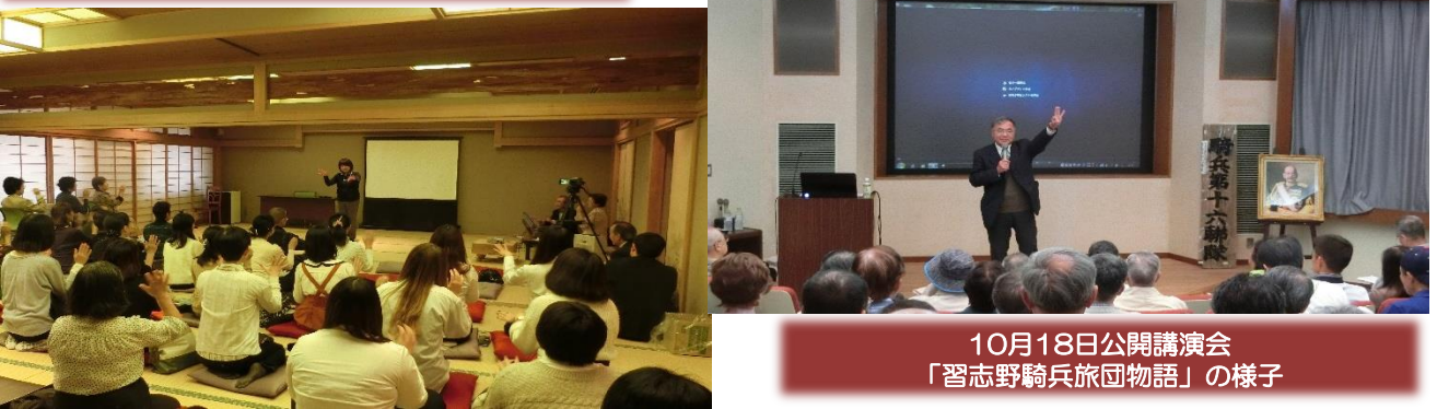
10月18日公開講演会 「習志野騎兵旅団物語」の様子