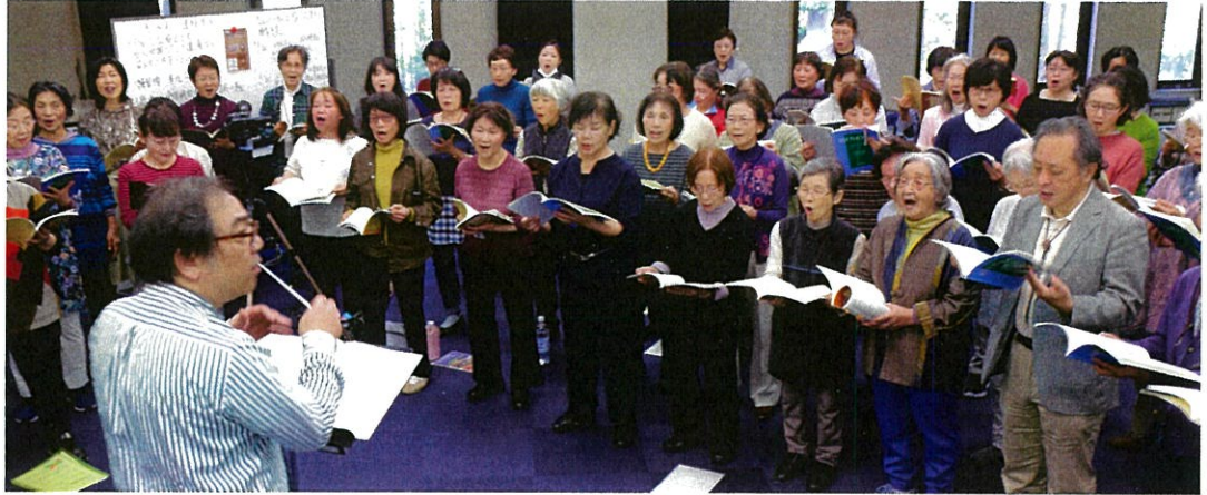
練習には東京、神奈川、埼玉など他の学習センター所属の学友も集まる