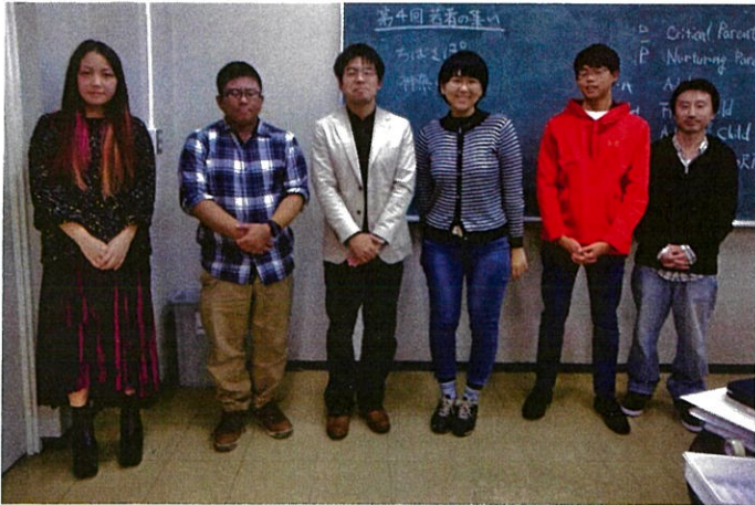
若者の会のメンバー