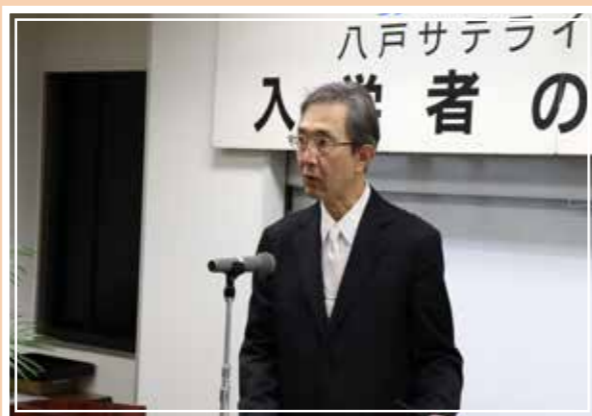
八戸サテライトスペース