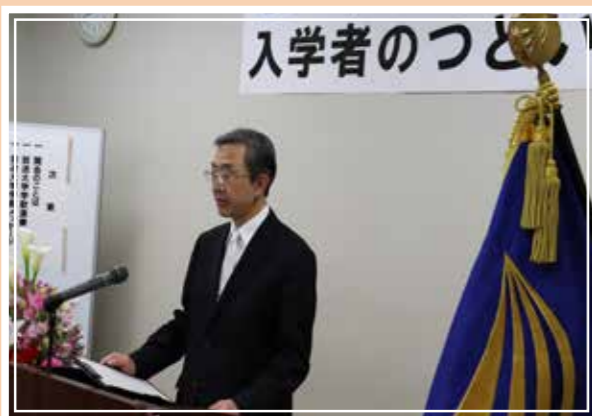
青森学習センター

放送大学学歌演奏や学長挨拶の上映、センター所長式辞、入学生と在学生代表の挨拶、学友会会長祝辞、教職員紹介のほか、オリエンテーションや施設見学などを行いました。