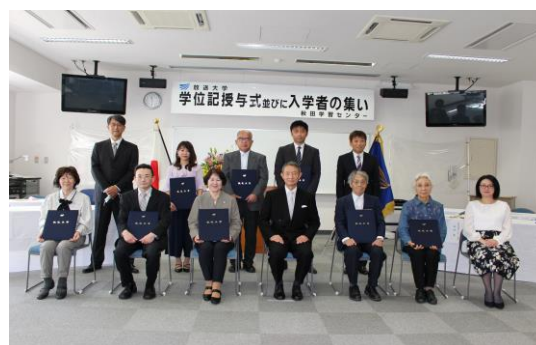
学位記授与式 記念撮影