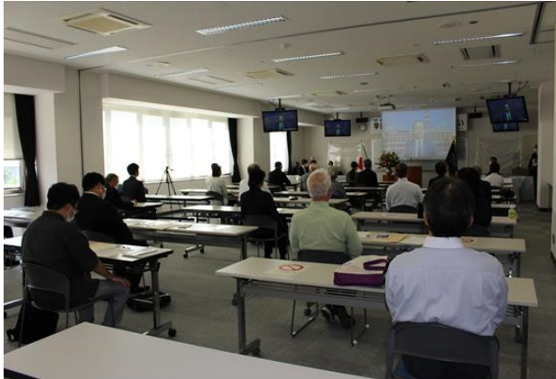
入学者の集いの様子（学長挨拶）