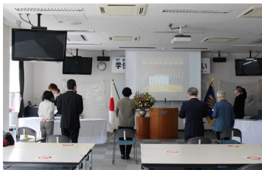
学位記授与式の様子(学歌演奏)

なお、学位記授与式の様子が秋田さきがけ新聞(2021年10月14日)に、記事として掲載されました。