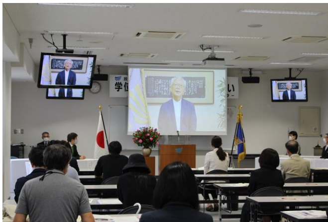
入学者の集いの様子（学長挨拶）

2020年度第2学期入学者138名の皆様、ご入学おめでとうございます。 10月4日(日)秋田学習センターにて「2020年度第2学期入学者の集い」が開催され、18名の新生が参加しました。新たな学習への思いを胸に新学期が始まりました。 ご参加いただいた皆様、ありがとうございました。