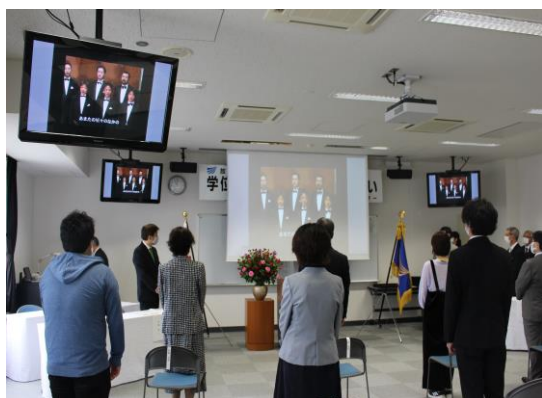
学位記授与式の様子(学歌演奏)

秋田学習センターでは、2020年度第1学期をもって、教養学部から15名の方々が卒業されました。10月4日(日)には、秋田学習センターにおいて、新型コロナウイルス感染予防のため通常通りの実施が難しい中での学位記授与式が行われました。卒業生10名が出席し、式は滞りなく終了しました。教職員一同心からお祝い申し上げます。