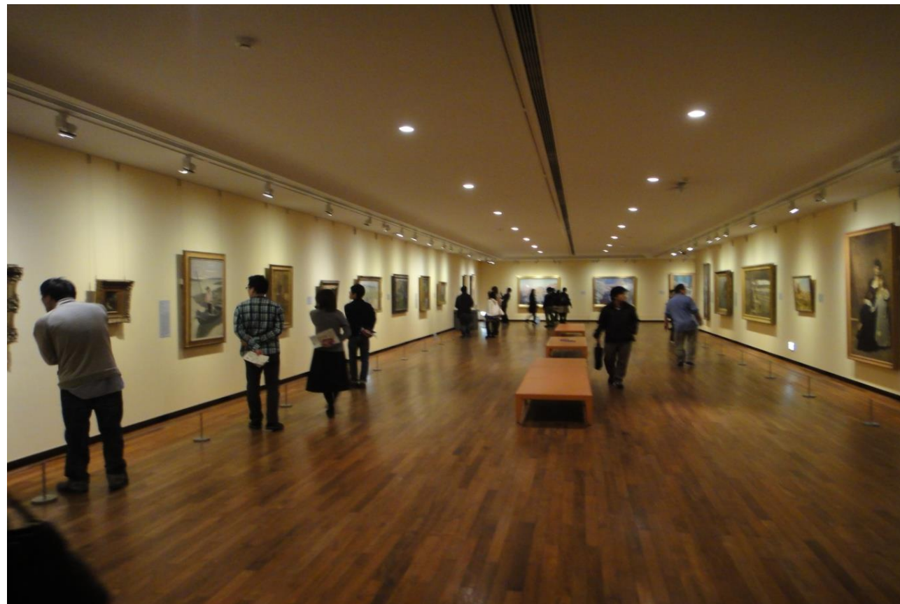
国立西洋美術館の内部