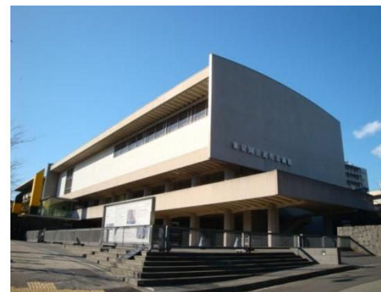
東京国立近代美術館