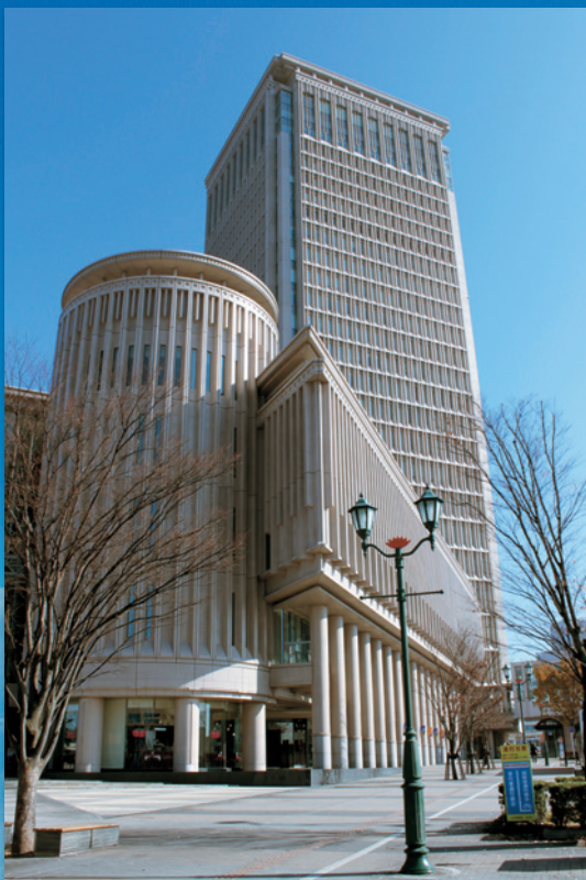
霞城セントラル(山形駅西/放送大学山形学習センター所在)