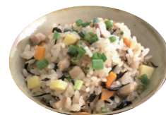
13日夜 ウンケージュシー

13日の御迎え（ウンケー）は、門口で灯明をともして、ご先祖様の霊を玄関でお迎えするように接し、夜は、どの家庭もウンケージュシー（豚三枚肉入りの炊き込みご飯）やなますなどでもてなします。