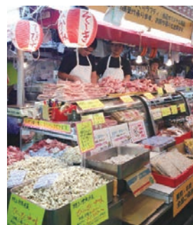
旧盆前の市場の様子

昔から祖先崇拜の国といわれている沖縄は、年中行事の60%は祖霊祭といわれています。その中でも最も大きな行事は「旧盆」です。準備に、各地の市場也大賑わい。那覇市牧志にある公設市場では、旧盆でお供えする重箱料理に欠かせない、豚肉（皮つき三枚肉）、沖縄ではとれない昆布やかまぼこといった食材のほか、先祖の霊がつけ代わりに使うといわれるサトウキビが店頭に並べられています。