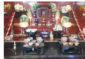
T家の旧盆 中日の昼のお供え料理

14日の中日（ナカビ）の昼は、冷やしゾーメンやさとうだんご（近年はあまがしをお供えする家庭もあり）などをお供えします。