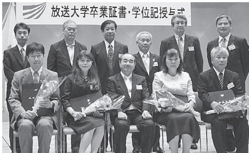
放送大学卒業証書・学位記授与式

平成27年9月27日(日)に、別府大学大分キャンパス文化ホールにおいて、平成27年度第1学期学位記授与式が行われました。教職員一同、心よりお祝い申し上げます。