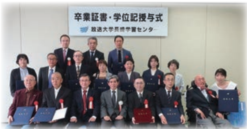
< 2023 年度第2学期卒業の皆さん >

令和6年3月、放送大学では4,240名が卒業・修了されました。 そのうち長崎学習センターでは30名の方が教養学部を卒業、3名の方が大学院を修了されました。 また、今回の卒業で1名の方が名誉学生の称号を得られ、4名の方が長崎学習センター特別表彰を受けられました。心からお祝い申し上げます。