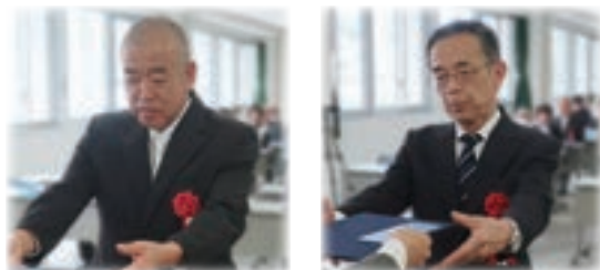
<長崎学習センター特別表彰>