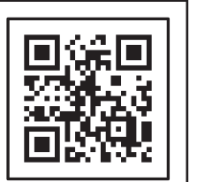
操作体験会 申し込みフォーム

予約申込方法:5月26日(日)までに、宮崎学習センター(0982-53-1893)にお電話いただくか、QRコードから申し込みフォームにアクセスして必要事項を入力するか、どちらかでお申し込みください。