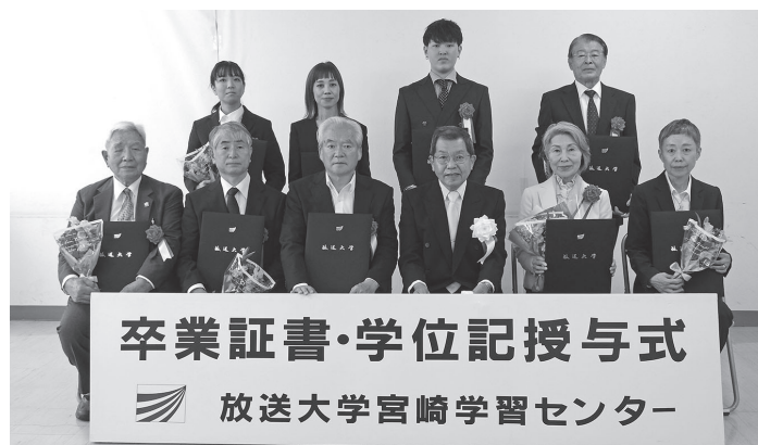
2023年度第2学期卒業生の皆様