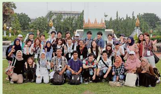
インドネシア スラバヤにて (日本・インドネシアの学生たちと)

コロナ禍を経て、世界はかえって近くなりました。グローバルな問題を解決するにあたって、世界中の人が手を取り合わざるをえません。今後、多様な価値観を理解し、いろいろな人と協働できる教養を涵養することが、ますます重要になるでしょう。