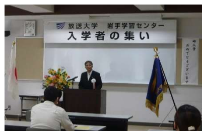
2023年度第2学期 入学者の集いの様子

※毎学期、入学者の集い終了後、卒業生・修了生のお祝いと新入生の歓迎を兼ねて、学友会と合同で「交流会」を同会場にて開催しておりましたが、前学期同様中止することとなりました。ご理解のほどお願いいたします。