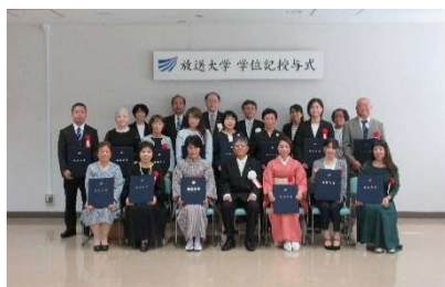
2023年度第1学期 学位記授与式の様子