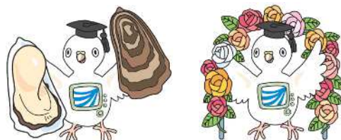
放送大学マスコットキャラクター