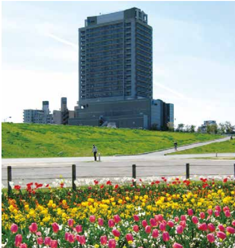
虹の広場から見た学びピア21